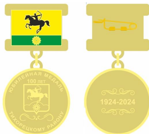
РИСУНОК юбилейной медали, посвященной 100-летию образования Тихорецкого района

С обратной стороны колодка оснащена креплением «безопасная булавка».